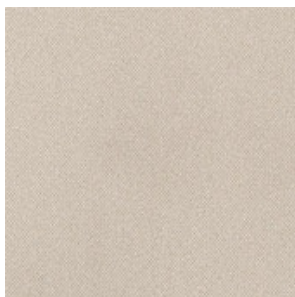
REVESTIMIENTO DEL TECHO