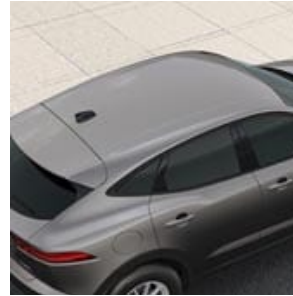
COLOR DE LA CAPOTA