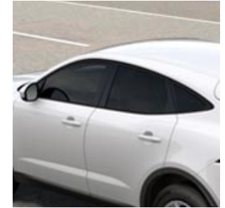
MARCOS DE VENTANILLA