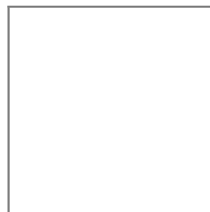
OPCIONES DE FRENOS