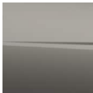
TIPO DE COLOR