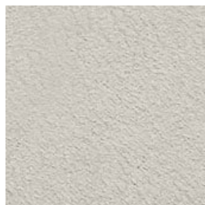
REVESTIMIEN- TO DEL TECHO