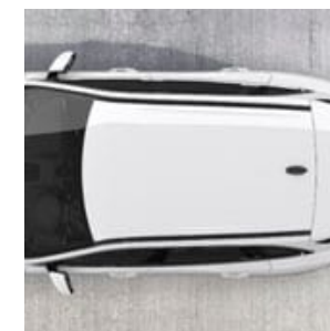
RAÍLES DEL TECHO