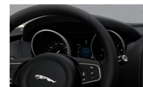
PANTALLA DEL CON- DUCTOR