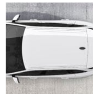
OPCIÓN DE TECHO