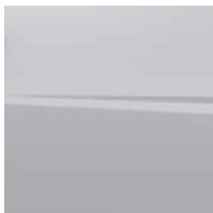
COLOR EX- TERIOR