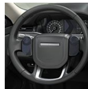
COLUMNA DE DIRECCIÓN