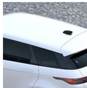
TIPO DE TECHO