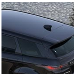
COLOR DEL TECHO