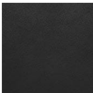
NIVEL DE ACABADO