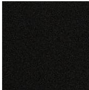
REVESTIMIENTO DEL TECHO