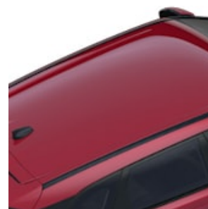
COLOR DE LA CAPOTA