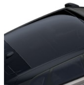
TIPO DE TECHO