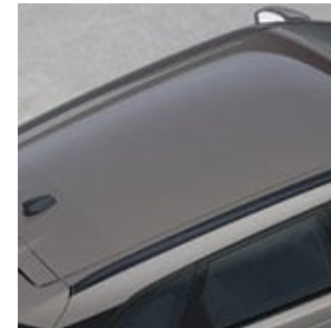
RAÍLES DEL TECHO