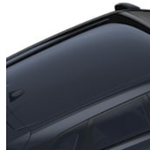
COLOR DE LA CAPOTA